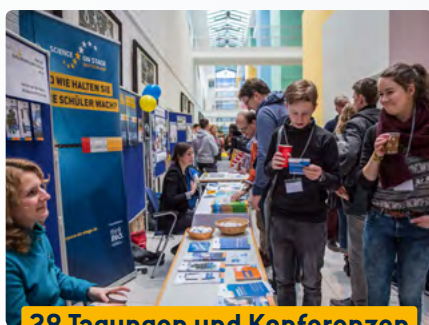
28 Tagungen und Konferenzen

Ein internationales Lehrerteam entwickelte Unterrichtsmaterialien zur Sprachförderung mit Experimenten in der Grundschule rund ums Thema ‚Haus‘.