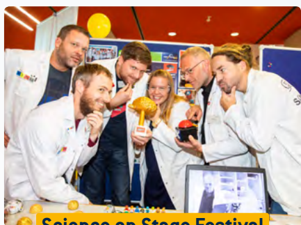
Science on Stage Festival

MINT-Lehrkräfte aus ganz Deutschland tauschten auf der Ideenbörse gelungene Unterrichtskonzepte für die Primar- und Sekundarstufe aus.