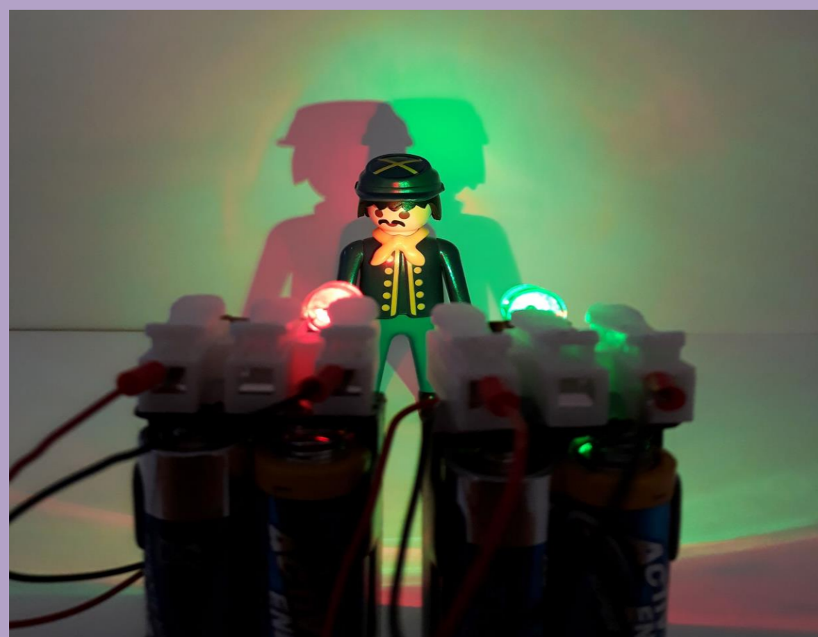
Licht und Schatten

Rascher Aufbau - Keine Werkzeuge - Keine Verletzungsgefahr