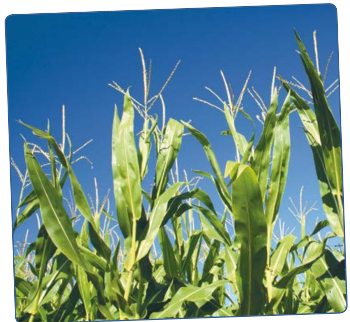
Mais ist eine vielseitige Pflanze. Sie liefert Nahrungsmittel oder kann zu Kraftstoff verarbeitet werden.

Was braucht man, um eine gute Forscherin oder ein guter Forscher zu werden? Man muss vor allem neugierig und begeisterungsfähig sein, sagt Regina Palkovits.